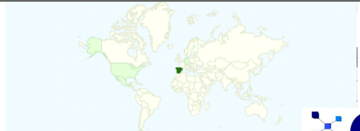
Gráfico de visitas por ubicación